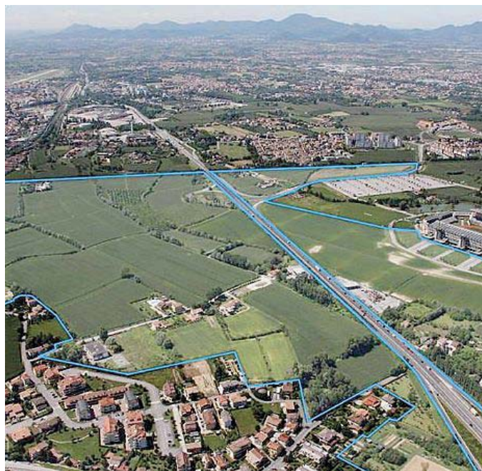
L'area di Padova Ovest dove era previsto il nuovo ospedale