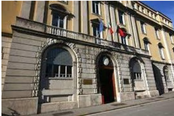
Il Palazzo di Giustizia di Aosta