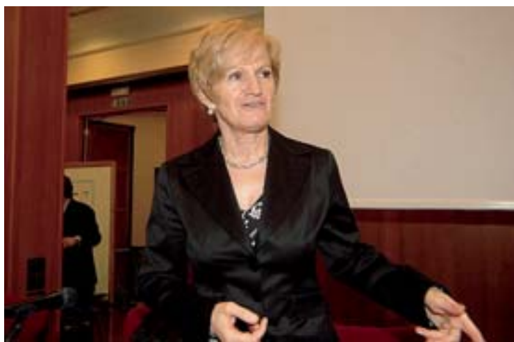
La ministra della Salute Livia Turco

L'idea di «organizzare la speranza», come dice don Francesco Savino, parroco del noto Santuario dedicato ai Santi Medici, per i malati che necessitano di cure continuative, nasce sin dal 1999 da un'esperienza personale vissuta dal sacerdote bitontino, allorché aveva accompagnato un confratello, colpito da una grave forma tumorale, alla Domus Salutis di Brescia, primo Hospice in Italia. «Nella visita a quella struttura così ben organizzata e nella necessità di un centro di cure per l'amico sacerdote - racconta