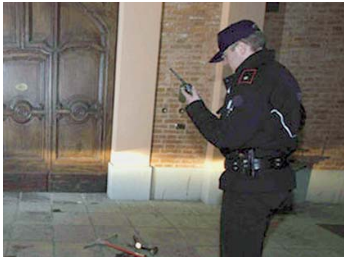
Una guardia giurata in azione

Le verifiche fiscali della guardia di finanza di Bari sono state potenziate in tutto il territorio. E nel mirino della finanza non sono finiti solo gli istituti di vigilanza privata, ma anche tutte le altre categorie. Dai muratori ai tappezzeri, dagli idraulici agli elettricisti, dai carrozzieri ai meccanici, dai parrucchieri agli estetisti. Tutte le categorie che abitualmente rilasciano meno scontrini e fatture rispetto a tutte le altre. Controlli serrati anche nei confronti dei professionisti, soprattutto medici che lavorano in studi privati.