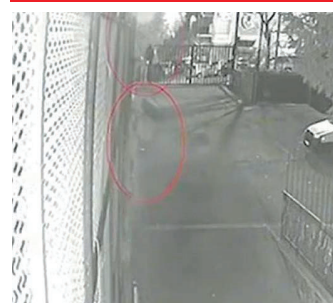
Video Ripreso mentre si arrampica sulla ringhiera della caserma

«I carabinieri e gli agenti della Digos hanno un 34enne egiziano, regolare sul territorio nazionale e con precedenti di polizia, perché considerato l'autore degli attentati incendiari del 9 e 24 febbraio scorsi, commessi rispettivamente presso le sedi della Compagnia carabinieri di Castel Gandolfo e del Commissariato di polizia di Albano Laziale. Il reato contestato dal gip è quello di strage politi-