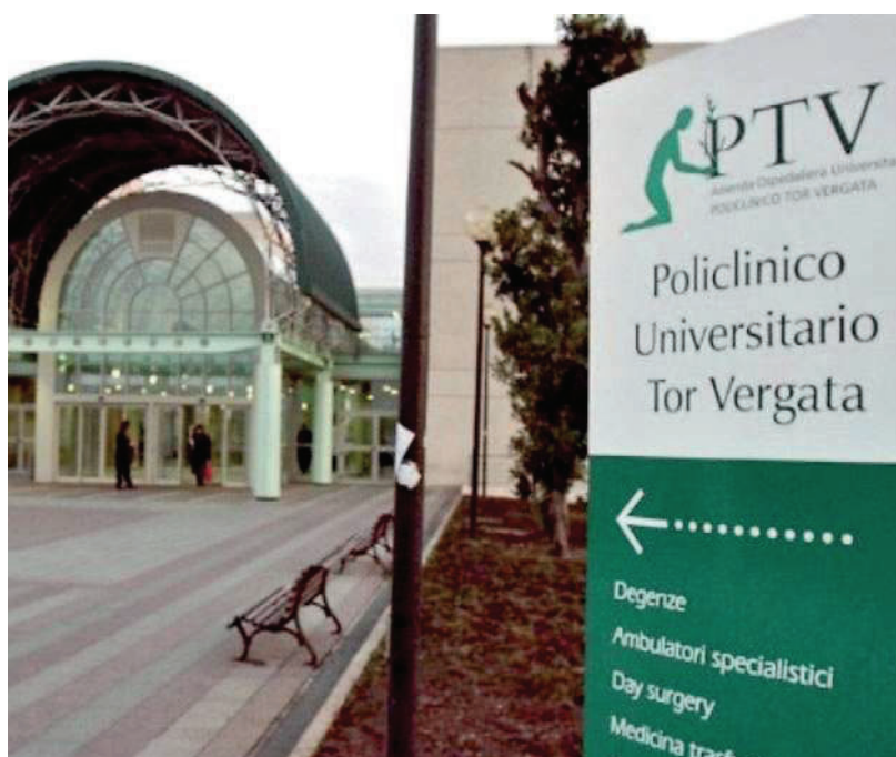
Il policlinico di Tor Vergata

Mercoledì si riunirà la commissione disciplinare dell'ospedale. Spetterà a quest'organo decidere che tipo di sanzione infliggere al professionista. Dei sei presenti in