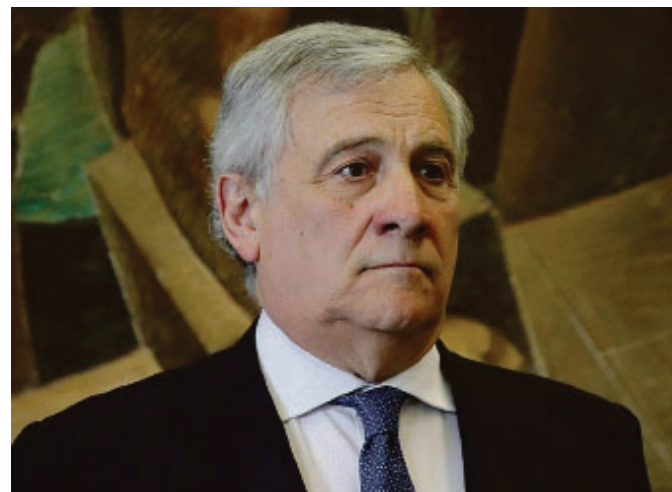
AL TIMONE (PER ADESSO) Antonio Tajani, ministro degli Esteri

«È stata una riunione molto tranquilla», ha sottolineato il senatore Maurizio Gasparri , «non ci sono stati particolari dibattiti, è stata