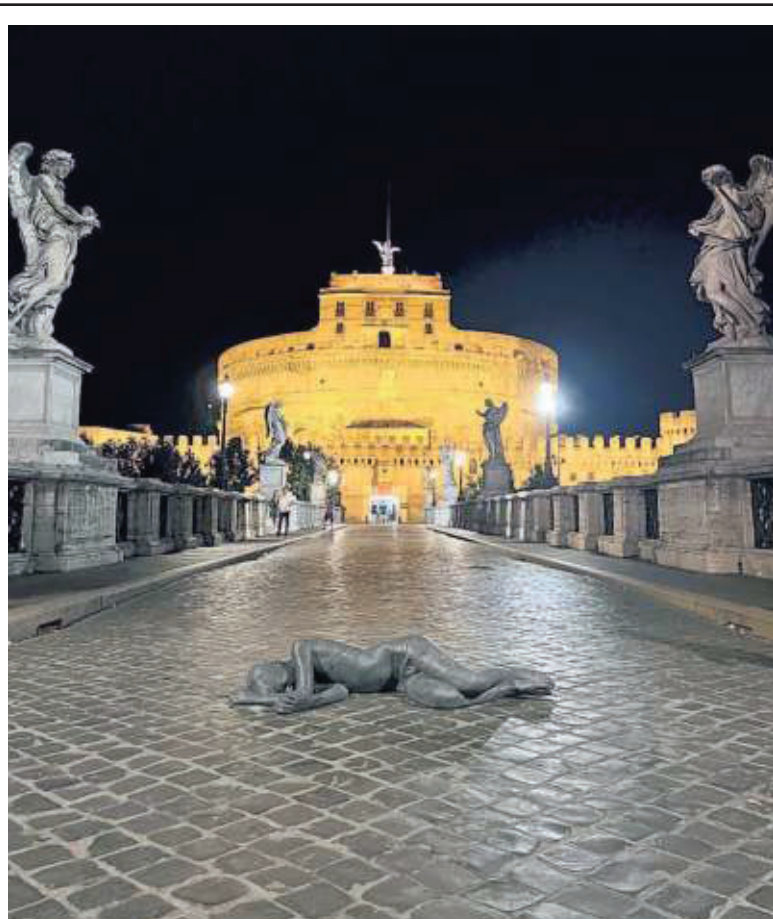
▲ Simbolica La statua di Jago vandalizzata a Ponte Sant'Angelo