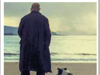
▲ Al cinema Una scena del film