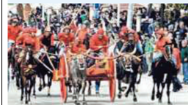
▲ Sotto accusa La corsa a Chieuti