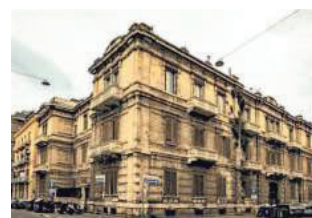
▲ L'ex Nautico Palazzo Zuccaro