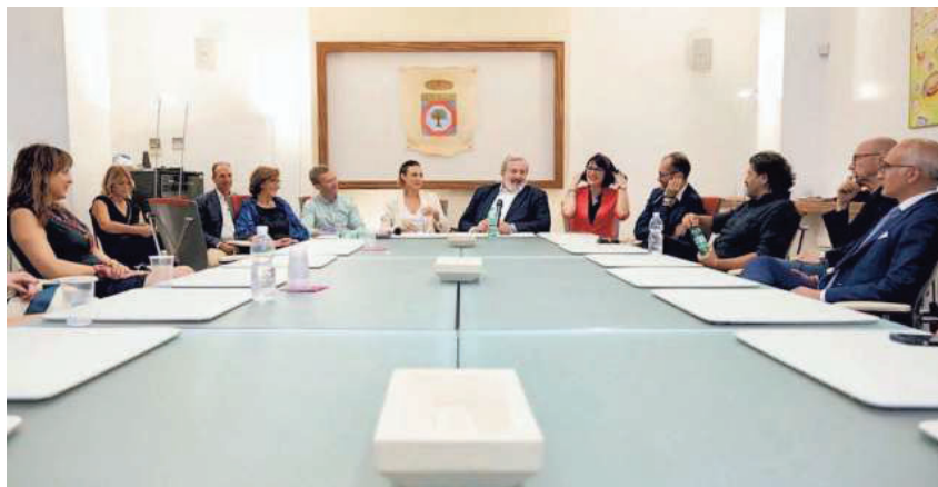
▲ Otto giugno 2022 La presentazione della prima edizione di Allora Fest a Roma

di Lucia Portolano e Anna Puricella • a pagina 3