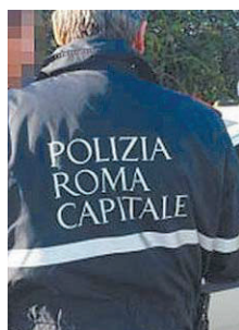
Polizia locale Ha scoperto la discarica

••• Gli agenti della polizia locale di Roma Capitale del IX Gruppo Eur hanno scoperto una discarica abusiva di mille metri quadri a Castel di Leva. Sono stati rinvenuti oltre seimila metri cubi di calcinacci e materiale di risulta da cantiere, sversati illegalmente. Ulteriori verifiche hanno portato all'individuazione del responsabile, un italiano di 60 anni, denunciato per violazione della normativa ambientale. Dovrà rimuovere l'immondizia a proprie spese e bonificare l'area, che è stata sequestrata.