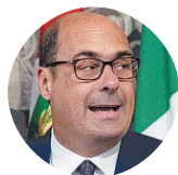
Nicola Zingaretti Presidente della Regione Lazio

va alla New Master Police sarebbe più complessa, in quanto «parte delle fatture indicate sono state pagate», mentre altre sarebbero ancora ferme «in quanto la società non ha fornito all'ente regionale la documentazione e i chiarimenti richiesti».