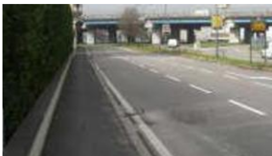
Cologno Monzese Felice Cavallotti