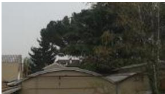
Macherio Laghetto 6332 mq,