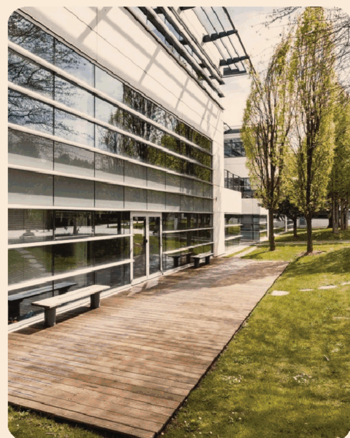
Campus di Stormshield a Lione

Oltre a vantare un consolidato pacchetto clienti nel mercato nazionale e internazionale, Kriptia ha recentemente aumentato di 100mila euro il proprio capitale sociale, confermando un costante trend di crescita. www.kriptia.it