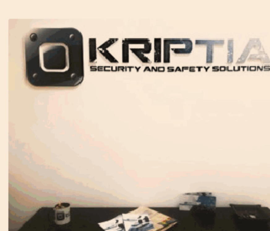
I nostri uffici centro di lavoro e di confronto