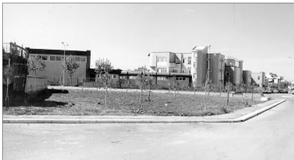
Una veduta di Apricena