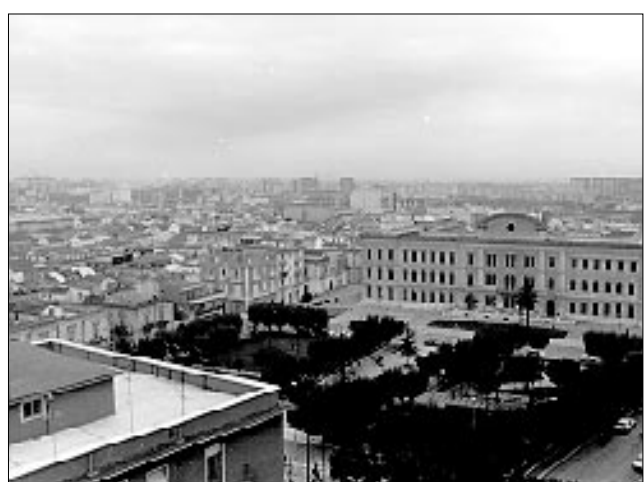
Dibattito sull'accesso ai Por

SAN SEVERO - «Sui piani operativi regionali l'amministrazione comunale ha fatto "flop", alcuni miliardi di finanziamenti persi, forse, irrimediabilmente». Il coordinamento comunale dell'Ulivo punta il dito contro l'amministrazione di centro-destra che governa Palazzo Celestini, accusata di non operare concretamente per gli interessi della città ma di fare solo propaganda. Dopo l'approvazione delle graduatorie di ammissione ai finanziamenti regionali, il Comune di San Severo è stato praticamente escluso dei circa 600 miliardi di spesa pubblica che saranno presto erogati. Dall'Ulivo denunciano «l'immobilismo della maggioranza di centro-destra e l'incapacità di portare concretamente lo sviluppo sul territorio».