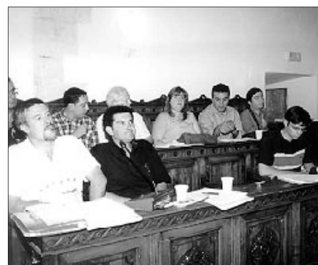
Il consiglio comunale