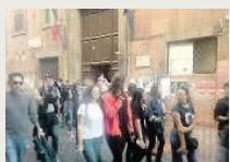
Gli studenti lasciano il liceo

«Manipolo di delinquenti, stop alle gite»