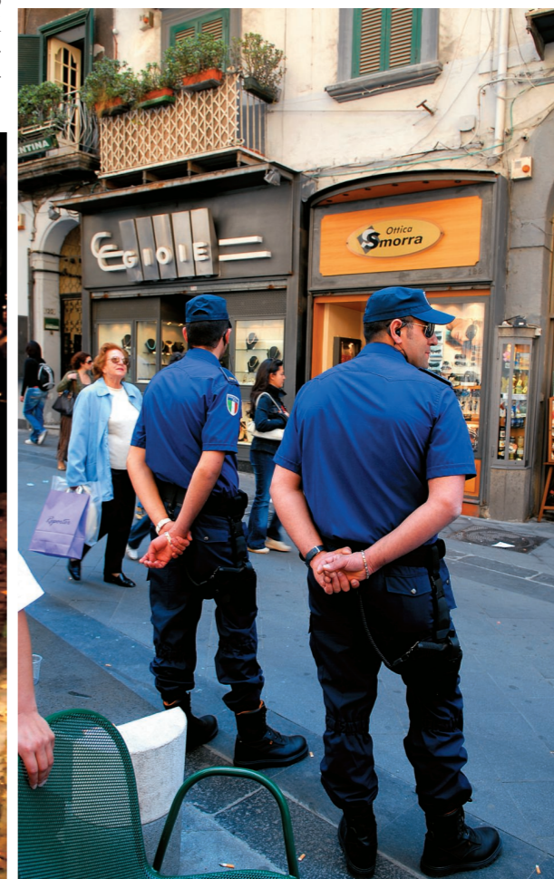
Vigilantes in una strada del centro di Napoli. A sinistra: due pregiudicati uccisi a Torre del Greco

Il Tribunale: "Uomini disonesti e privi di scrupoli". Da loro dipende l'80 per cento del movimento di soldi