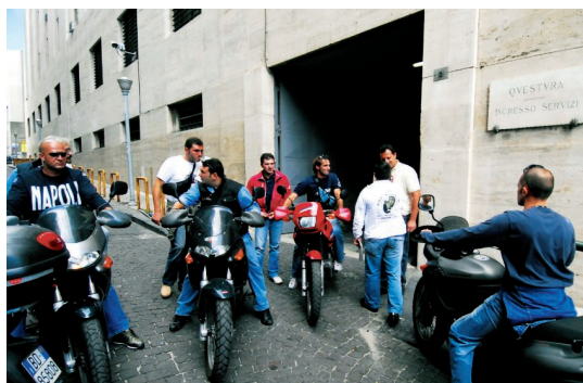
Una pattuglia dei "falchi" della polizia ai Quartieri Spagnoli. Sopra: vigilantes al Banco di Napoli in piazza dei Martiri

Ma forse, in tema di "mezzi" per affrontare la criminalità, dovremmo pensare di più all'unico strumento davvero democratico ed efficace: il processo e la condanna. Forse non tutti sanno che la legge prevede che il contrasto di polizia, nel caso più fortunato, ossia che vi siano elementi per l'arresto in flagranza, dura al massimo 48 ore.