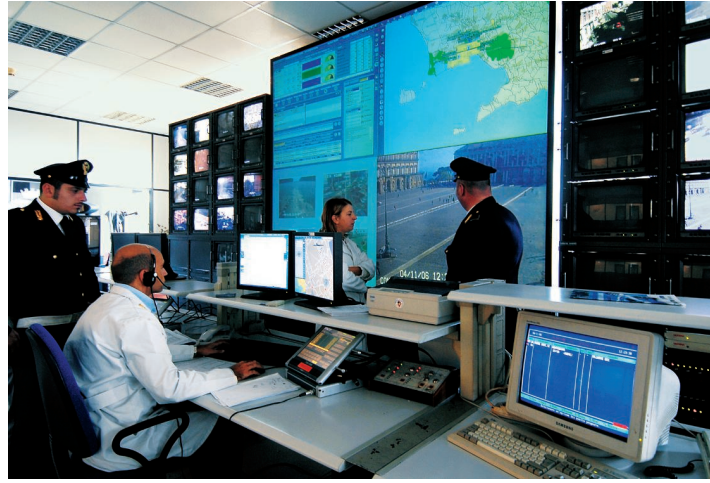
La sala operativa della Questura di Napoli

cio personale (100) e l'ufficio immigrazione. Per i carabinieri la media è di uno a uno: metà in strada e metà in attività logistica e d'ufficio. La camorra conta invece su 1.260 affiliati in città. E 1.220 in provincia. È il censimento aggiornato alla scorsa settimana secondo le mappe consegnate alla Prefettura e al Viminale (vedi tabelle). In tutto 2.480 camorristi soltanto nel Napoletano, in base a indagini già concluse o ancora in corso. Ai quali vanno aggiunti le mogli, i figli, i familiari. El'indotto: il sottobosco di migliaia di persone che arrotonda lo stipendio, vive, ha