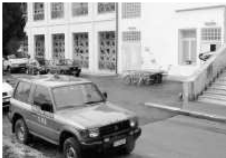
L'ingresso della zona cremazione a Mirteto