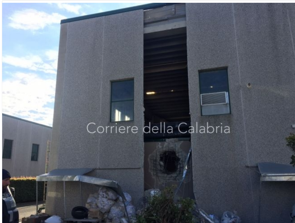
Il caveau della Sicurtransport sventrato per la rapina del dicembre 2016

circostanze false, come una richiesta di divenire consulente della Procura di Catanzaro. Lo scopo? Quello di poter dimostrare a tutti di far ancora parte del “giro” e utilizzare l'apparenza a proprio vantaggio. Nel suo tentativo, l'ex luogotenente del Goa riuscirà a mantenere, anche dopo il proprio congedo, rapporti istituzionali con i rappresentanti della Dea, agenzia federale degli Usa per il contrasto al narcotraffico internazionale. E, secondo l'accusa, fornirà informazioni riservate a «soggetti contigui con personaggi intranei ad ambienti criminosi».