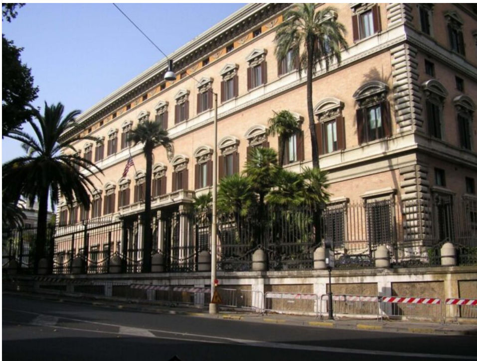
L'ambasciata americana a Roma