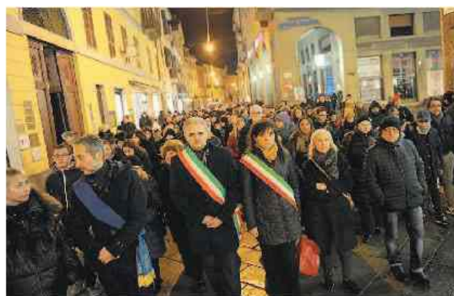
La marcia silenziosa ieri sera nel centro di Vercelli

In mattinata anche l'Asl di Vercelli, sempre con un post su Facebook, aveva manifestato solidarietà. «La voce della #donne, le parole delle donne. Spesso inascoltate - si legge nella nota - Lunedì mat-