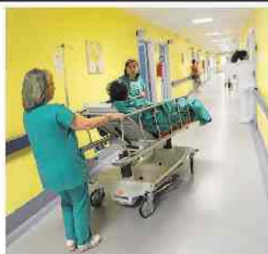
L'Asl presenta i dati del 2018

sesia. Allo stesso tempo diminuiscono i consumi grazie ad alcune strategie come un migliore utilizzo dei farmaci e delle apparecchiature mediche e una migliore organizzazione interna per la gestione dei pazienti.