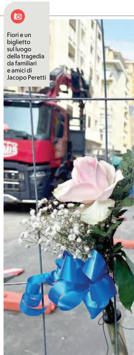
Fiori e un biglietto sul luogo della tragedia da familiari e amici di Jacopo Peretti