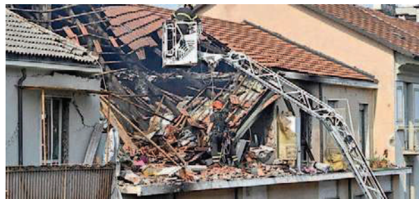
Il quinto piano devastato in via Nizza

L'ira dei sopravvissuti "Non abbiamo più nulla Poteva ammazzarci tutti"