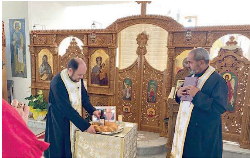
➔ La cerimonia nella parrocchia ortodossa romana Santa Pelagia Martire