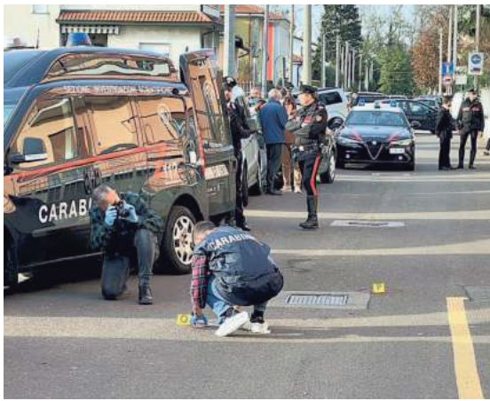
▲ Via Acquedotto | I rilievi dei carabinieri davanti alla casa della tragedia

Ai militari legnanesi, coadiuvati dal reparto investigativo di Milano e coordinati dal sostituto procuratore di Busto Arsizio, Massimo De Filippo, il compito di ricostruire i fatti. La coppia era sostanzialmente sconosciuta alle forze dell'ordine ma si complica la situazione del padrone di casa, guardia giurata, per quanto riguarda la custodia dell'arma da fuoco che aveva in casa.