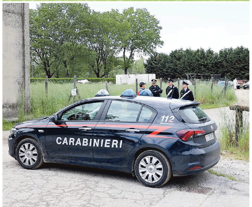
Due immagini dei carabinieri intervenuti mercoledì pomeriggio a Paese dopo il duplice omicidio