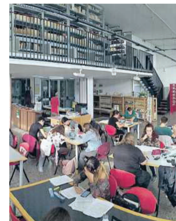
La biblioteca Filippo Testa

IL SODALIZIO NATO 30 ANNI FA COMPRENDE TREDICI COMUNI E FAVORISCE IL PRESTITO INTERBIBLIOTECARIO