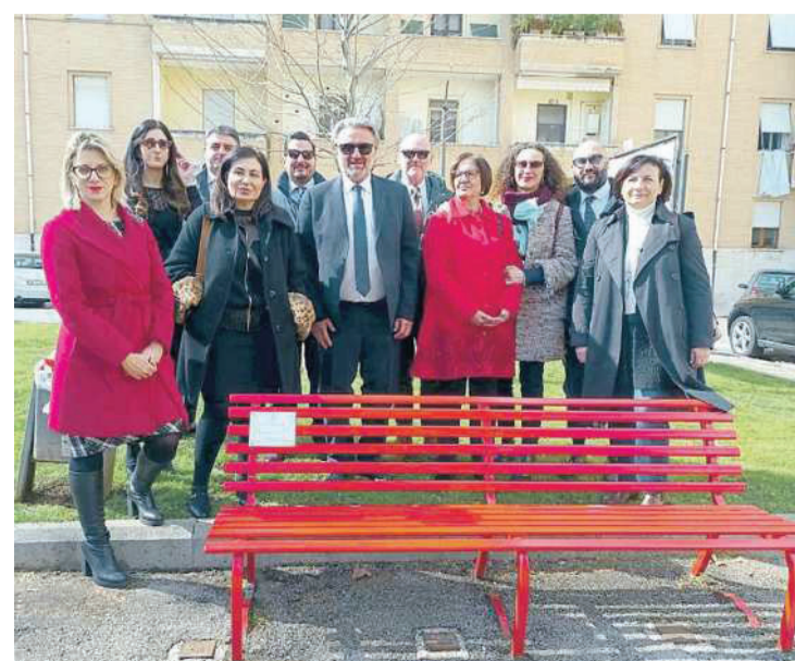
La panchina rossa inaugurata ieri mattina

carta che ricopriva la panchina, entrambi rigorosamente rossi. Un monito certo contro alcuni reati specifici che ormai da qualche tempo hanno subito una escalation: quotidianamente arrivano all'attenzione delle forze dell'ordine e poi nelle cancellerie dei magistrati denunce e procedimenti per stalking, maltrattamenti in famiglia, lesioni e violenze nei quali praticamente sono sempre le donne le vittime. E spessissimo tali abusi vengono commessi all'interno delle mura domestiche da un familiare, circostanza che a volte rappresenta un forte freno per la donna a denunciare: anche nelle situazioni più drammatiche prevale la paura e molte violenze rimangono soppite e soprattutto impunte.