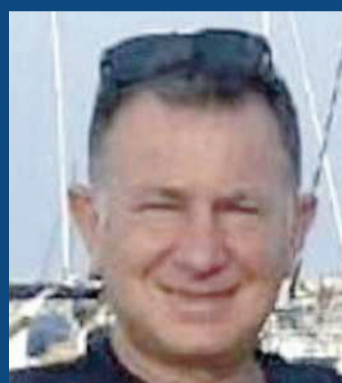
UN GESTO FOLLE PER LA GELOSIA

Il carabiniere dopo essersi costituito è stato sottoposto a un lungo interrogatorio per ricostruire il movente e la dinamica dell'omicidio. Secondo la rico-