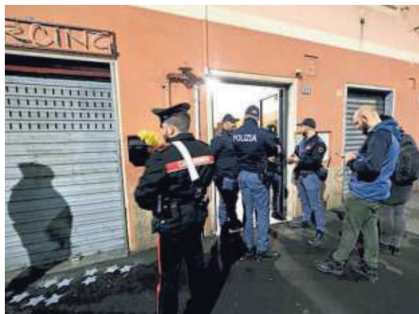
Il luogo della strage