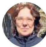
CACCIONI CENTRO ANTIVIOLENZA MASCHERONA

Pregiudizi che negli studenti più grandi diventano "la mia ragazza vestita così in giro non ci va se non ci sono anche io, altrimenti me la guardano". Costruzioni culturali e sociali che al centro anti violenza provano a smontare «attraverso una crescente attività di volontariato. Nel 2022 abbiamo formato quattrocento studenti di ogni ordine e grado, attraverso 215 ore di incontri: lo facciamo perché ci crediamo. Ma quello che manca è un progetto nazionale codificato: un'azione costante, e non finanziamenti spot che servo-