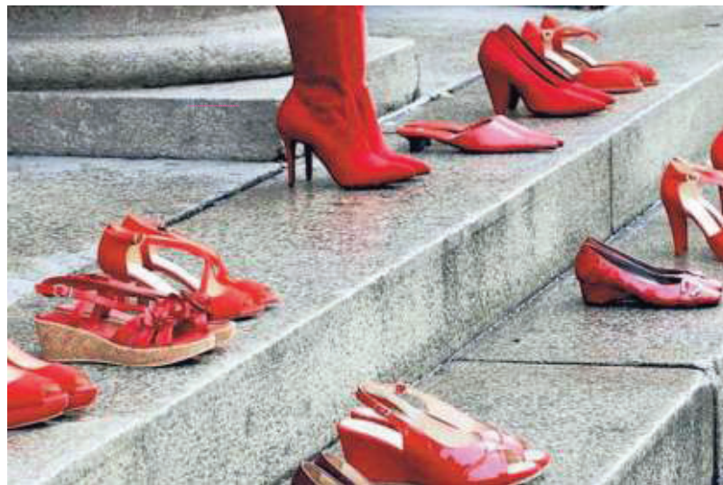
▲ Scarpe rosse. Diventate il simbolo contro la violenza sulle donne

Bisogna fare formazione con i giovani fin dall'asilo altrimenti si creano degli stereotipi