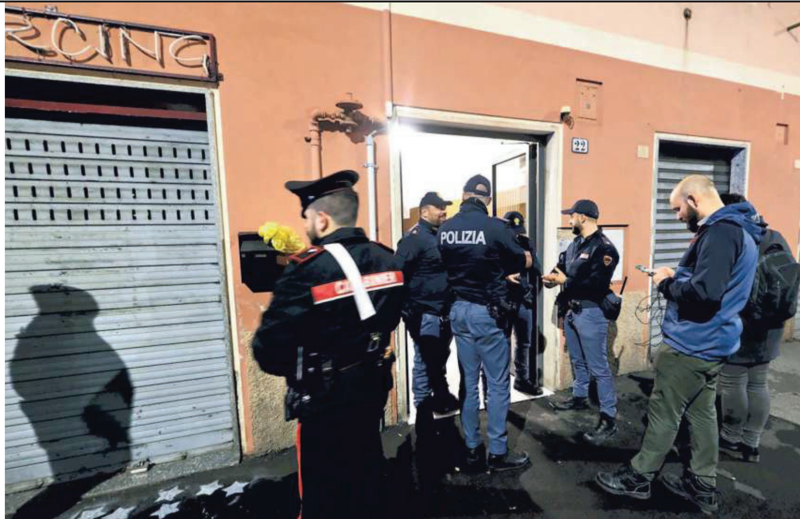
IL FEMMINICIDIO DI PONTEDECIMO