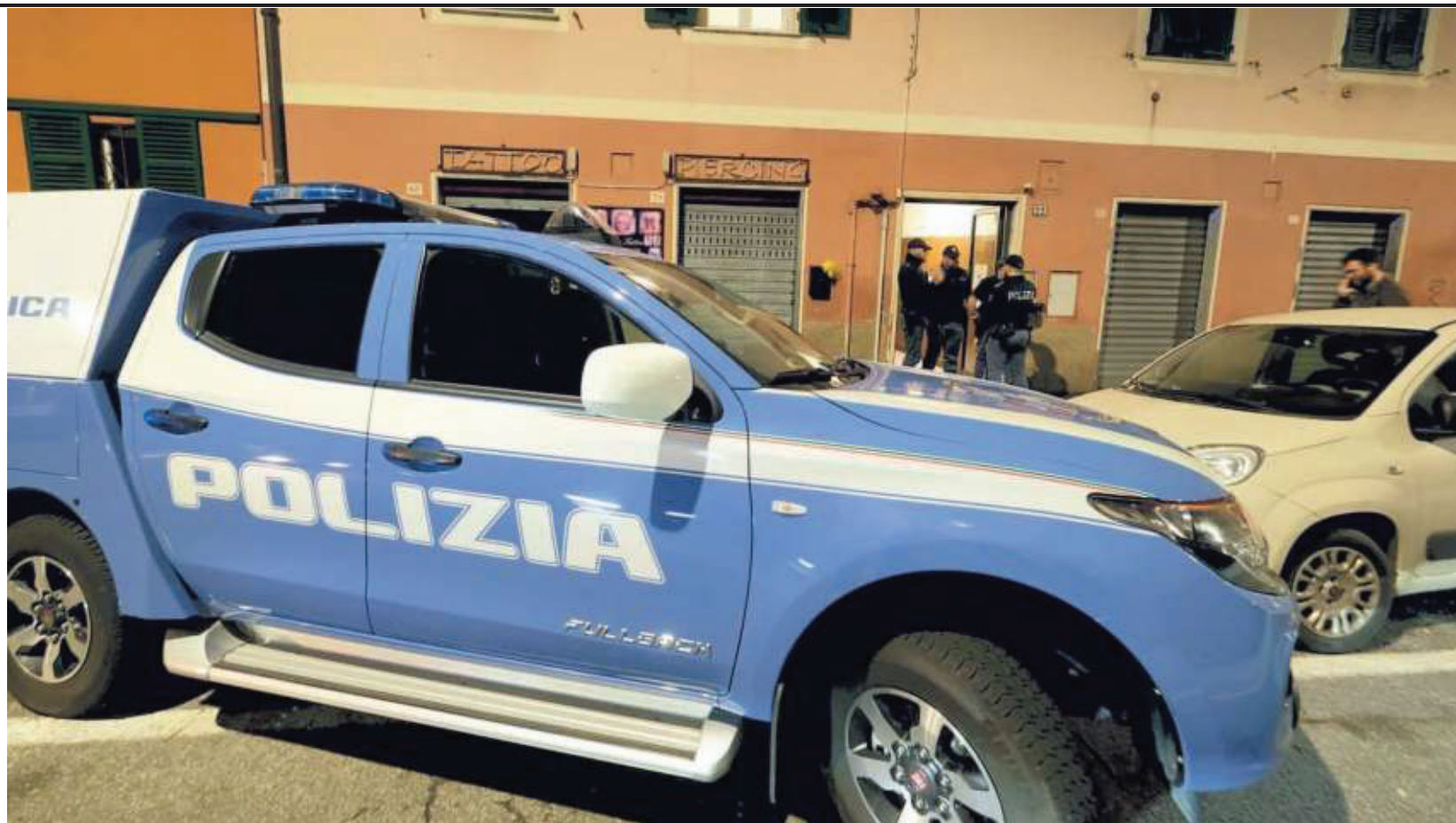
► Via Anfossi Il palazzo dove si è consumato l'omicidio suicidio, i vicini non hanno sentito il rumore degli spari LEONI

La ragazza trovata nel suo letto ed è probabile che sia stata uccisa durante il sonno. Nella stessa stanza a terra l'uomo con la pistola di ordinanza ancora in pugno.