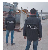
Polizia Coordinata dalla Dda di Roma

side» della polizia di Stato e coordinata dalla Direzione distrettuale antimafia di Roma. Il sodalizio criminale, dedito allo smaltimento illecito di rifiuti, attraverso sversamenti abusivi, anche di scarti tossici, era riuscito a ottenere profitti elevatissimi. E con il denaro ottenuto illegalmente faceva affari, poco trasparenti, nel settore immobiliare.