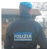
Indagine Compiuta dalla Penitenziaria

nale. Durante il colloquio, infatti, gli agenti hanno notato movimenti anomali e, dopo una perquisizione in cella al termine del colloquio, hanno trovato hashish nascosto in uno slip. Il plauso del Sappe del Lazio va al personale del corpo di polizia penitenziaria che, ancora una volta, ha stroncato sul nascere la detenzione e l'uso di droga in carcere».