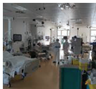
Santorso La terapia intensiva

●● Un'infermiera 61enne bassanese colpita dal Covid-19 è grave. Non si era vaccinata e non soffre di particolari patologie. L'operatrice sanitaria, dipendente dell'Aulss 7, è stata ricoverata all'ospedale di Santorso proveniente da quello di Bas-