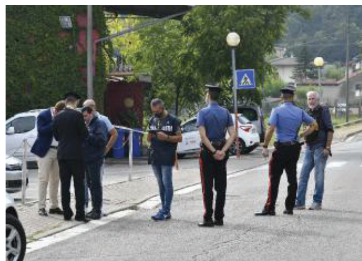
Gli inquirenti Forze dell'ordine e magistrato sul luogo del delitto

«Ma chi può essere stato? Magari un ladro, uno sconosciuto, chi?» sono le doman-