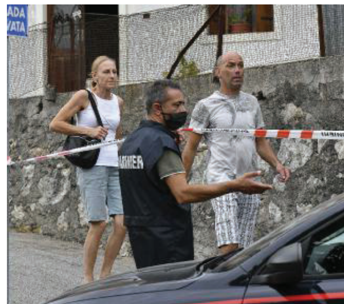
I parenti i genitori della vittima in contra' Viale a Valdimolino