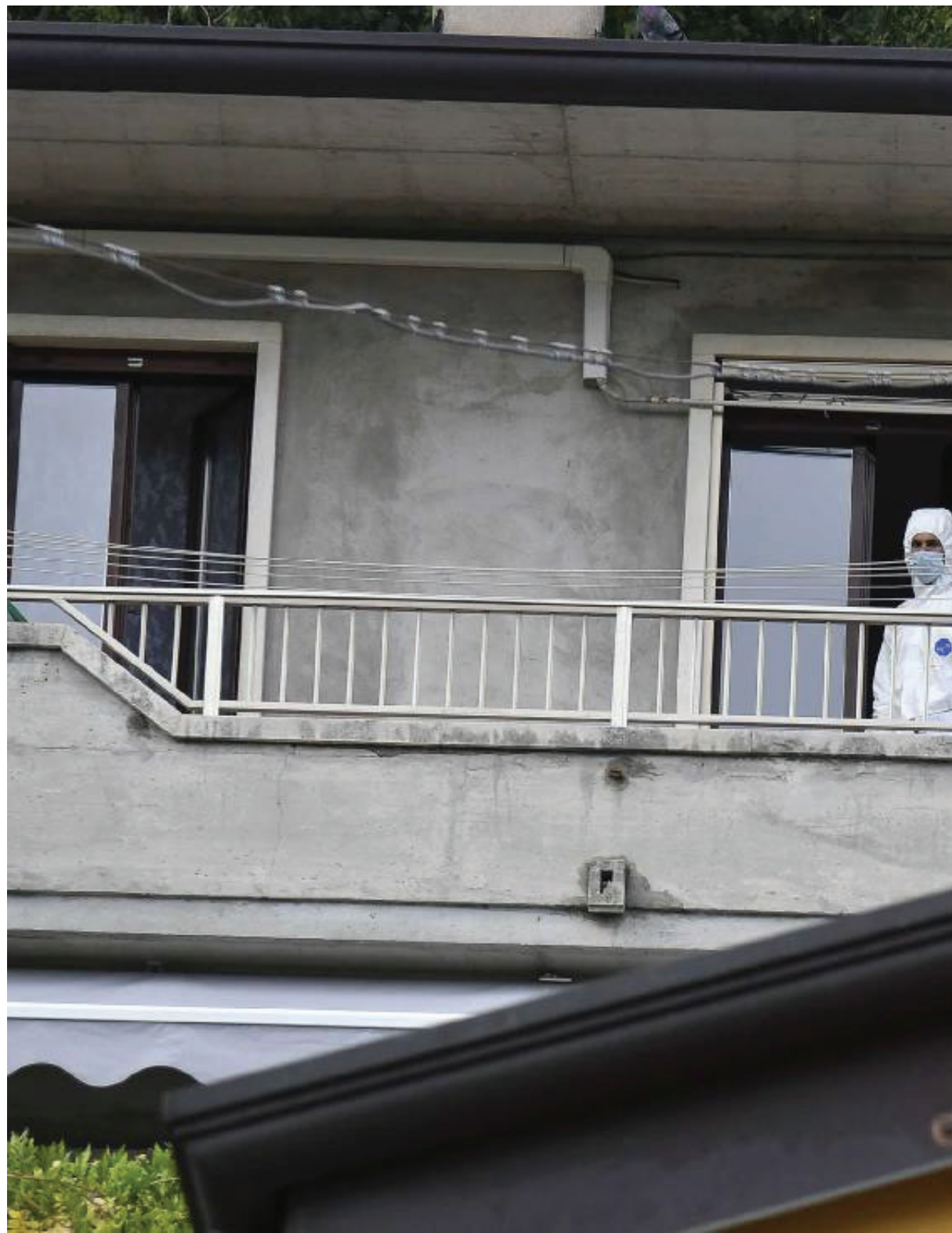
Gli accertamenti dopo l'omicidio Intervento dei carabinieri nell'abitazione dove è morta la giovane.