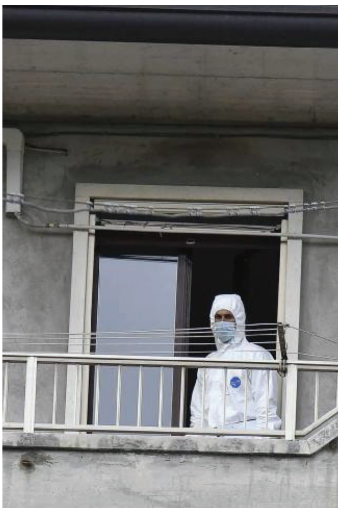
La casa. Inquirenti eseguono i rilievi sul luogo del delitto

Femminicidio, siamo ancora qui a piangere le vittime e a chiederci come affrontare quest'emergenza sociale che, da tempo, non è più un'emergenza. Perché colpiva prima e colpisce durante la pandemia. Avviene al Nord e al Sud. Quasi sempre (nove volte su dieci) per mano di un uomo che la donna assassinata conosceva. segue a PAG.46