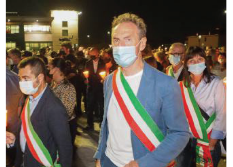
I sindaci Una ventina quelli presenti alla fiaccolata contro i femminicidi

L'europarlamentare del Pd Alessandra Moretti aggiunge, allargando il raggio di analisi: «Otto donne ammazzate in sette giorni: dobbiamo fermare questa mattanza. Vanno aumentati i fondi per i centri antiviolenza e promossi percorsi educativi a partire dalle scuole elementari. Serve una legge europea contro la violenza sulle donne online e off line, come ha annunciato la presidente della Com-