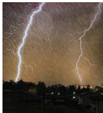
Tuoni e fulmini Meteo pessimo

●● Il cambio di stagione è prossimo. Piogge e grandinate sono attese nel fine settimana e congederanno l'estate, lasciando spazio ai vestiti più pesanti. La Regione ha diramato l'allerta per il rischio di forti precipitazioni con una riduzione della temperatura anche di 10 gradi. In cronaca pag.21