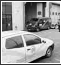
COLPO GROSSO A GARDOLO