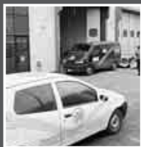
COLPO GROSSO A GARDOLO