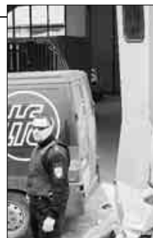
La sede della Tfa

l'ora, stavano dormendo, quindi non hanno potuto fornire indicazioni utili alle indagini. Ripresa l'attività, alla Tfa resta da fare il conto dei danni; non si conosce l'esatto ammontare della cifra rubata, né l'entità dei danni alla struttura: la ditta a cui sono stati commissionati i lavori fornirà al più presto un preventivo di spesa. E.A.M.