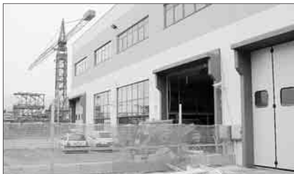
PAURA. La sede della Tfa a Spini di Gardolo dopo la rapina milionaria

Altro complice armato, che ha fatto irruzione non appena il caterpillar ha divelto il portone d'accesso, non ha dovuto brandire l'arma: la guardia giurata era già riuscita a portarsi in salvo sa-