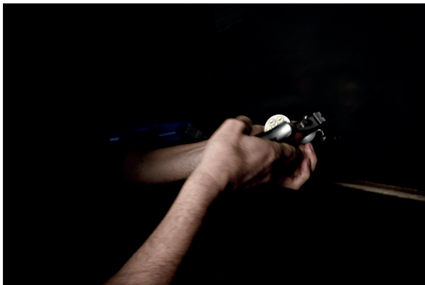
ESERCITAZIONI DI TIRO CON LA PISTOLA NEL POLIGONO DI CISTERNA (LATINA). A FARE PRATICA CON LE ARMI SONO SOPRATTUTTO COMMERCianti CHE VOGLIONO IMPARARE A DIFENDERSI