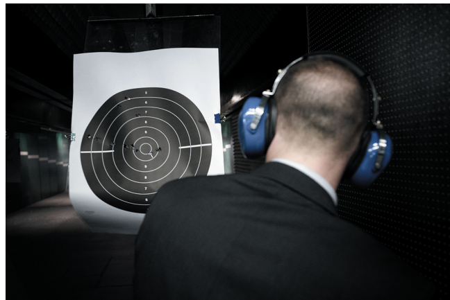
TRE IMMAGINI DELLA PRATICA DI TIRO PERSONALE CON IL REVOLVER PER AUTODIFESA

Non abbiamo il record dei “ferri” in circolazione: 12 armi da fuoco detenute legalmente ogni 100 abitanti, contro le 45 in Finlandia, 31 in Francia e Svezia, 30 in Germania. Ma siamo i primi assoluti come impiego: 0,71 omicidi da arma da fuoco ogni 100mila abitanti, contro lo 0,45 in Finlandia, 0,06 in Francia, 0,19 in Germania. Più che il numero di armi in circolazione in uno Stato, conta la psicologia dei suoi abitanti. Ed è proprio questo il punto. Pochi giorni fa a Riese Pio X, provincia di