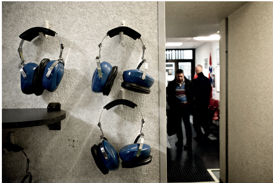
ALL'INTERNO DEL POLIGONO DI TIRO. SOTTO: I BOSSOLI ESPLOSI DURANTE LE ESERCITAZIONI PRIVATE

All'ora dei telegiornali serali, come tutte le caserme di paese, chiude la stazione dei carabinieri di Legnaro, nel Padovano. «In caso di mancata risposta, telefonare al 112», è scritto sul cartello all'ingresso. Il tempo di attesa dipende da dove siano le due o tre pattuglie in servizio su un'area grande quasi quanto Firenze. In città andrebbe addirittura peggio: inutile