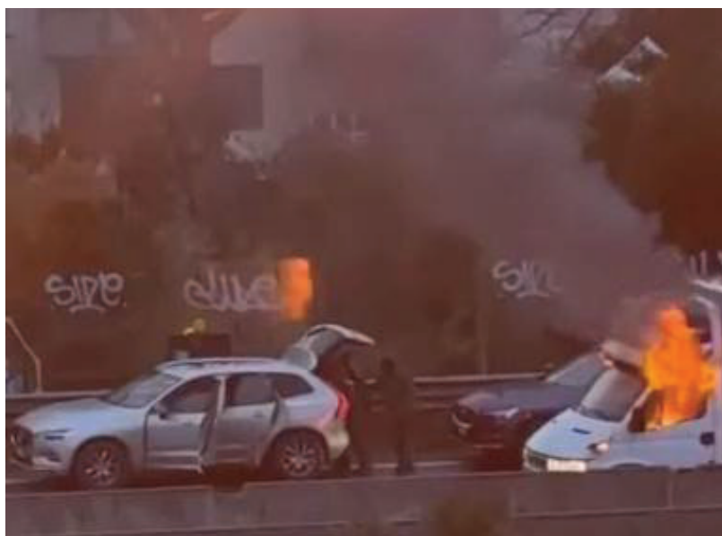
I rapinatori e in alto a sinistra l'auto presa a un medico di Orbetello e ritrovata

Professionisti del crimine, ma nonostante un'organizzazione para-militare, qualche sbavatura c'è stata nel colpo da 4 milioni di euro al furgone portavalori. Ed è su queste piccole falle che stanno lavorando i carabinieri del nucleo investigativo di Livorno in collaborazione con le altre forze di polizia. Ieri mattina gli inquirenti sono tornati sulla superstrada (chiusa al traffico la corsia sud) per ulteriori rilievi e raccolta dei bossoli che nella notte non erano visibili. Le perizie balistiche diranno se le armi usate per il colpo a San Vincenzo hanno firmato altri assalti ai furgoni portavalori che negli ultimi mesi sono diventati frequenti. A San Vincenzo sono stati sparati venti colpi di fucili da guerra (probabilmente da quel che si capisce dalle immagini Aks, una versione del famoso Ka-