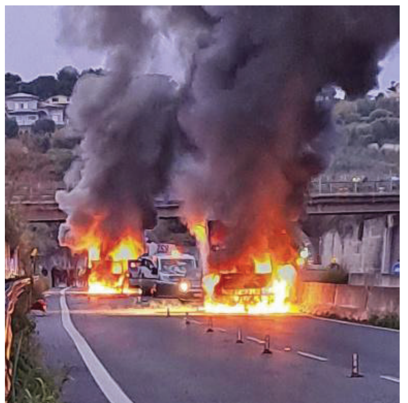
I furgoni in fiamme dopo il colpo al portavalori