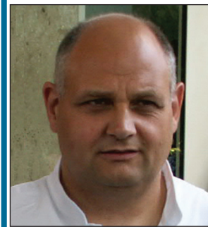
● SERVIZIO A PAG. 11

PD: a Cave no al vino nuovo in vecchie otri