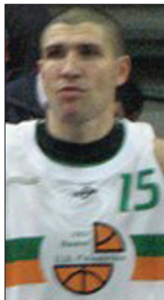
● Da pagina 15