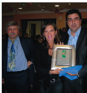
● SERVIZIO A PAG. 6

Dal 2 al 5 gennaio 2008 Molte novità nella nona edizione del Memorial Iaia