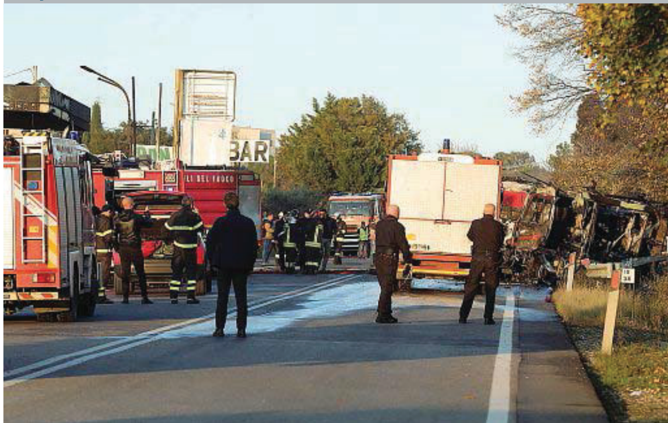
L'automezzo dei vigili del fuoco distrutto dall'esplosione è sul lato destro della Salaria, proprio davanti al distributore