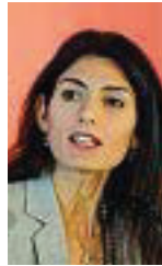
Sindaca Virginia Raggi