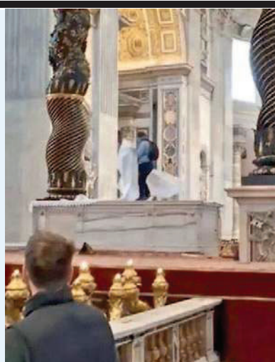
▲ San Pietro Un frame del video che riprende l'atto di vandalismo in San Pietro: l'uomo in piedi sull'altare

CITTÀ DEL VATICANO – È salito sull'altare della confessione di San Pietro e ha lanciato a terra sei candelabri del 1865 del valore di circa 30mila euro. L'uomo, un cittadino di origini romene con «gravi disabilità psichiche», ha riferito il Vaticano, è stato subito fermato dai gendarmi ed è stato poi identificato e denunciato dagli agenti dell'ispettorato della polizia italiana. Ora rischia una multa salata. A giugno del 2023 un uomo era salito sull'altare completamente nudo per protesta contro la guerra in Ucraina. A ridosso del giubileo il Vaticano ha introdotto la reclusione da uno a quattro anni e la multa da 10mila a 25mila euro per «chiunque fa ingresso nel territorio dello Stato della Città del Vaticano con violenza, minaccia o inganno». Una norma, fantasiosamente scambiata da alcuni per un giro di vite anti immigrati, adottata in vista del grande afflusso di pellegrini e turisti e del moltiplicarsi, in particolare dopo la pandemia, di casi di persone che danno in escandescenza attorno o dentro lo Stato del Papa. – i.sca.