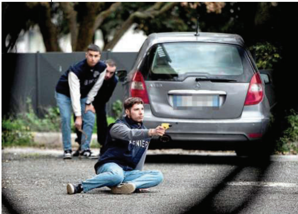
▲ I bossoli I rilievi in via Cassia a Roma dove un vigilante ha sparato ai rapinatori in fuga

Ecco come, secondo i pm, sarebbero andate le cose al civico 1004 di via Cassia, nella zona nord di Roma, a poche centinaia di metri dal Grande raccordo anulare. Qui, in un comprensorio già tartassato da continui furti, quattro ladri sono entrati al primo piano di una palazzina in mattoncini rossi. «Io ero in camera da letto, sono entrati dalla porta finestra sul balcone. Mi hanno immobi-