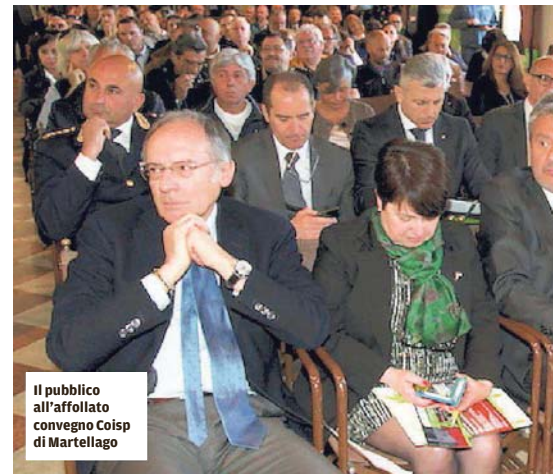
Il pubblico all'affollato convegno Coisp di Martellago

MARTELLAGO. «La sicurezza è la priorità per il governo. Anzi, deve essere la priorità delle priorità. I temi che interessano ai cittadini e sui quali si gioca il futuro sono infatti la sicurezza e il lavoro». Lo ha detto il sottosegretario alla Giustizia Cosimo Maria Ferri che si è inoltre soffermato sui temi in agenda per il governo: la tutela della vittima, la velocità della giustizia, la certezza della pena,