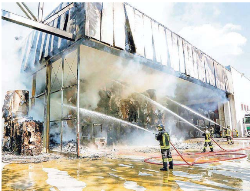
I vigili del fuoco impegnati nell'opera di spegnimento delle fiamme nel magazzino della cartiera Giorgione