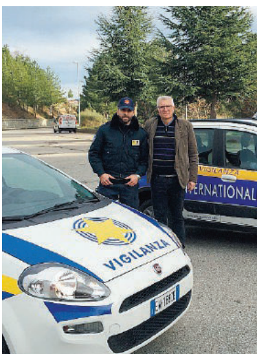
I vigilantes Hanno sventato il furto nell'istituto religioso