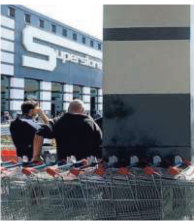
▲ L'Esselunga del Gignoro. È stata il teatro dell'aggressione

Tragedia evitata dalla guardia giurata che un attimo prima ha sganciato il caricatore della pistola