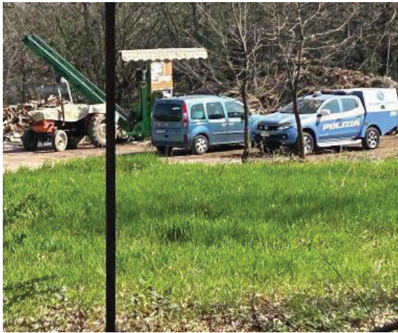
Nuovo sopralluogo della scientifica ieri mattina nel casolare di Vignola

Una banda di volti non nuovi al crimine, guidati da leader con una caratura criminale 'inquietante', quasi tutti pugliesi di Cerignola e due albanesi. Tra i soggetti in stato d'arresto anche un 60enne accusato di una violenta rapina in villa una decina d'anni fa. E il 'custode' del covo, un complice originario di Salerno e domiciliato a Vignola, pare da qualche tempo, dove aveva affittato il terreno agricolo. Le indagini coordinate dalla procura di Chieti insieme a quella modenese e che hanno portato a fermare la pericolosa banda prima che mettesse a segno il colpo, erano partite il 5 gennaio, quando i rapinatori avevano assaltato sull'autostrada A14, tra Ortona e Francavilla al Mare, il portavalori della società Aquila. Come avvenuto a giugno del 2021 nei pressi di San Cesario i rapi-