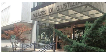
Il palazzo di giustizia di Belluno

va diverse cose: dalla guida delle ambulanze Ulss ai servizi sulle piste da sci di Misurina. Non era nemmeno facile evitarlo, ma c'era un continuo tentativo. I rapporti tra figlio e padre si sarebbero guastati dopo che quest'ultimo aveva smesso di pagare 800 euro al mese di mutuo per una casa che era di sua proprietà, ma era stata intestata al ragazzo in un momento di particolare crisi della sua attività di occhialeria: «Con quei