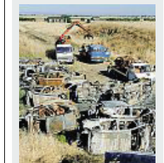
Il luogo Le vetture abbandonate

giornate all'immateriale Borsa di Cerignola: dai 1000 ai 3000 euro per le utilitarie; dai 3000 ai 5000 berline, suv e monovolumi; fino a 10000 per macchine dal valore superiore a 70000. Il margine di trattativa è ridotto, prendere o lasciare. E nel caso in cui il proprietario, spalle al muro e sempre più smarrito, sia disposto a ricomparsi l'auto che fino a poco fa era sua per davvero, il signor Wolf consulta un registro di classe: «Sì, c'è ancora. Ed è intera. Sei