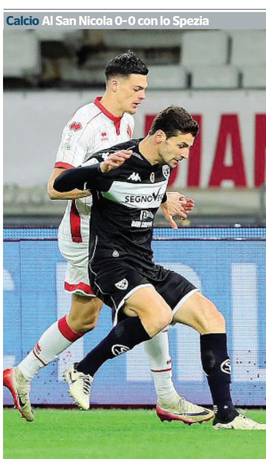
Calcio Al San Nicola 0-0 con lo Spezia

La Regione invia a Taranto il Nirs dopo il caso delle prenotazioni alterate di notte