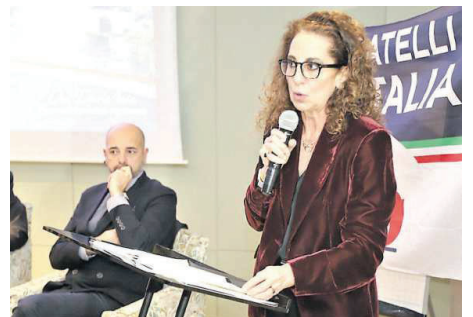
Wanda Ferro, sottosegretario all'Interno, a Taranto

Il decreto Sicurezza «risponde a nuovi pericoli. Si mettono nuove misure. Noi parliamo - ha aggiunto - di una legge sull'ordine pubblico che risale a molti anni fa» mentre «oggi abbiamo la necessità di poter intervenire soprattutto sull'utilizzo delle armi bianche da parte dei minorenni e sull'impossibilità di poter acquistare e di poter vendere ai minori, anche via web e con piattaforme elettroniche, armi da taglio. Questo significa anche responsabilità genitoriale rispetto a chi reitera determinate aggressioni. C'è poi il fermo preventivo di 12 ore in occasioni di manifestazioni dove le forze di polizia hanno elementi per essere preoccupate, come eravamo già consapevoli a cosa sarebbe arrivata Askatasuna». Il sottosegretario ha poi ricordato come il Gover-