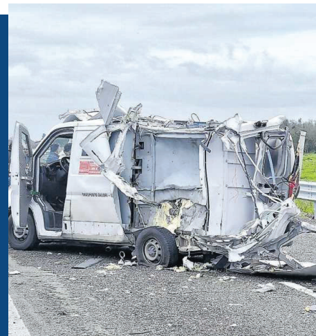
In quest'altra immagine il furgone portavalori poco dopo l'esplosione