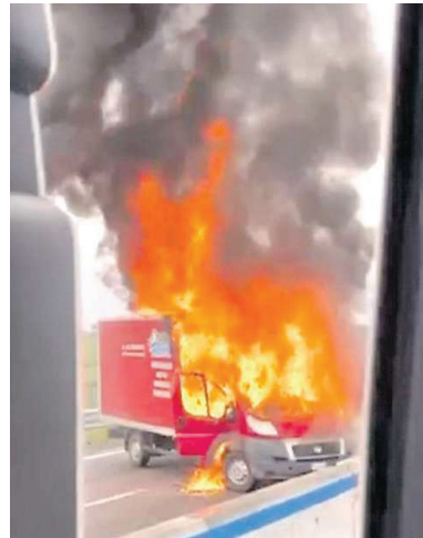
I momenti choc dell'assalto di ieri mattina

Sulla Brindisi-Lecce rapinatori armati e incappucciati hanno tentato di svaligiare il furgone della Battistolli. Conflitto a fuoco con i carabinieri, la fuga e poi gli arresti