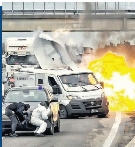
Le fiamme sulla superstrada mentre i banditi sono in azione