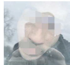
I fori sull'auto dei carabinieri causati dai proiettili fatti partire dal commando armato, e uno degli arrestati