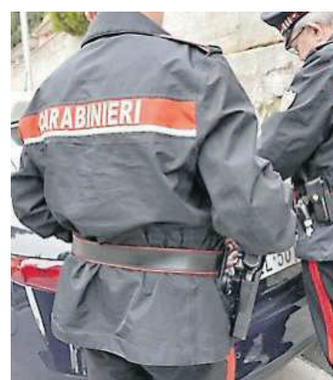
L'OPERAZIONE I carabinieri

guardia giurata di 56 anni, possedesse armi da fuoco, la figlia non ha esitato un istante allertando i carabinieri e una vicina di casa, pregandola di correre in aiuto della madre. Quando i militari della Stazione di Caserta sono arrivati sul posto, la donna era al sicuro nell'abitazione della vicina, tremante e in lacrime. L'uomo, invece, è stato rintracciato a bordo della propria auto a poca distanza e ai carabinieri ha consegnato una pistola regolarmente