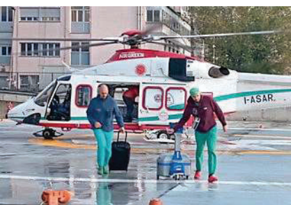
L'equipe torinese con il cuore da Udine

Una corsa (e un volo) contro il tempo, contro la pioggia e la nebbia che in questo periodo dell'anno avvolge il nord Italia, da ovest a est, senza esclusione di colpi. Tanto è bastato per salvare la vita a una donna torinese di 53 anni, nel cui petto, ora, batte il cuore di una ragazza di Udine, deceduta prematuramente per un'emorragia cerebrale, la cui famiglia ha deciso di compiere un gesto di profonda solidarietà. DALMASSO / PAGINE 24 E 25