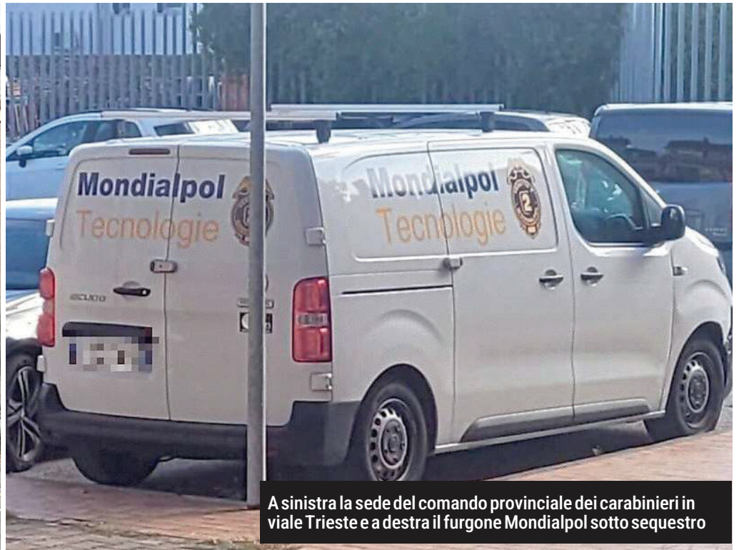
A sinistra la sede del comando provinciale dei carabinieri in viale Trieste e a destra il furgone Mondialpol sotto sequestro