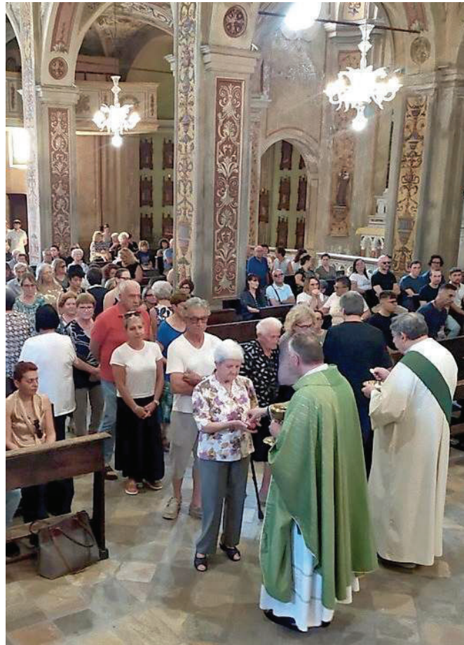
La messa nella chiesa dei santi Gervasio e Protasio a Mazzè

Per i funerali occorrerà attendere lo svolgimento dell'autopsia, che verrà disposta nei prossimi giorni dalla pm Chiara Canepa.