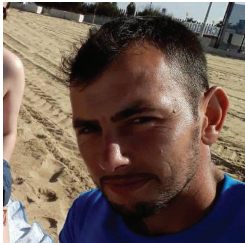
A sinistra, un momento della vasta operazione di polizia all'interno del carcere della Dogaia di Prato. Qui sopra, Vasile Frumuzache, il "killer delle escort"