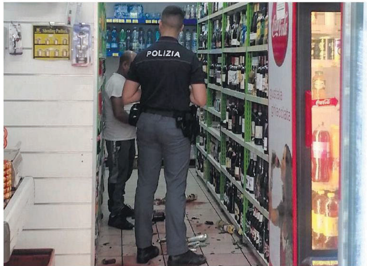
Il negozio di alimentari devastato giorni fa da due nordafricani

E ha aggiunto: «Facciamo la nostra parte per la tutela e l'orientamento di coloro che rischiano di subire discriminazioni e il piano prevede una serie di iniziative che il Comune, con tutte le sue direzioni e la città, deve promuovere per superare il rischio delle discriminazioni, non solo quelle legate ovviamente al genere e orientamento sessuale ma anche in altri ambiti. Sul piano più specifico si tratterà anche di fare formazione per tutti gli operatori che hanno rapporti con i cittadini, per rapportarsi nel modo più corretto, e poi metteremo a punto azioni per promuovere in modo positivo il riconoscimento dei diritti. È un piano che stiamo scrivendo e che presenteremo nel dettaglio». «Milano da molti anni è al fianco del Pride con il patrocinio», ha aggiunto Bertolè - «ma non è un atto dovuto bensì una convinzione perché le città e i comuni sul tema delle discriminazioni e dei diritti devono essere in prima linea e al fianco delle associazioni».