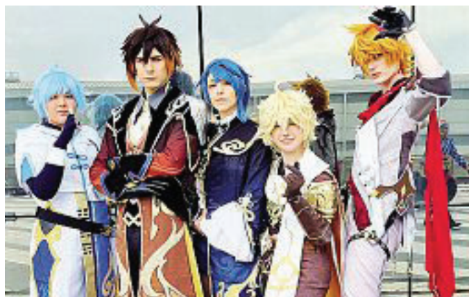
a pagina 13 Distefano In costume Un gruppo di «cosplay» che ogni anno affollano Romics

Dal 3 al 6 aprile la Fiera di Roma ospita la trentaquattresima edizione di Romics, festival del fumetto, animazione, cinema e games diretto da Sabrina Perucca, che assicura: «Sarà una grande festa della creatività, con oltre 350 espositori ed eventi in simultanea in cinque padiglioni, tra anteprime, mostre e incontri». I Romics d'oro in questa edizione saranno consegnati a Barbara Baraldi, Hal Hickel, Furuya Usamaru, Deanna Marsigliese.