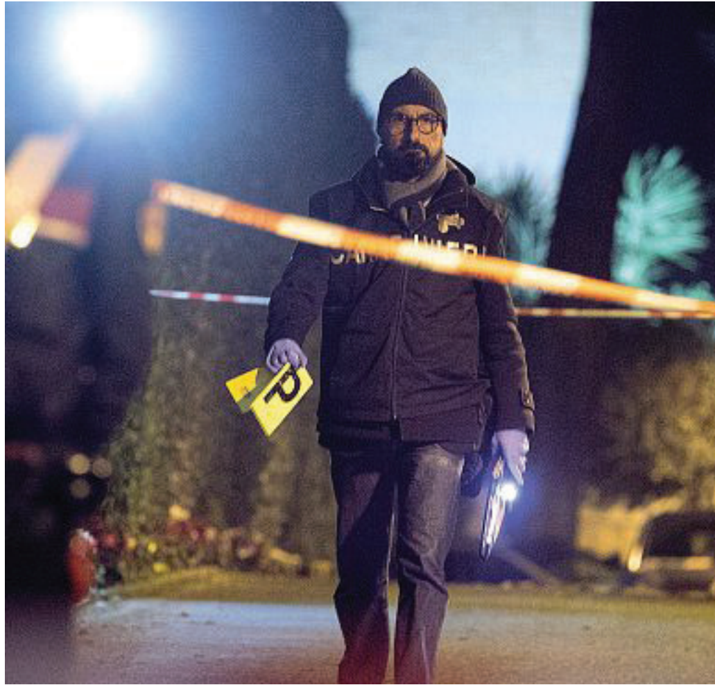
Al centro, i rilievi dei carabinieri il giorno dopo la tentata rapina e la sparatoria. Qui accanto ancora i militari che esaminano la scena del crimine la sera dell'omicidio