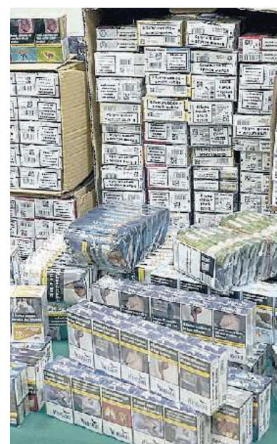
TABACCHI Una foto di archivio

NEI GUAI UN IMPIEGATO DEI MONOPOLI E UNA GUARDIA GIURATA: LA MOBILE HA ESEGUITO UN SEQUESTRO PER 170MILA EURO