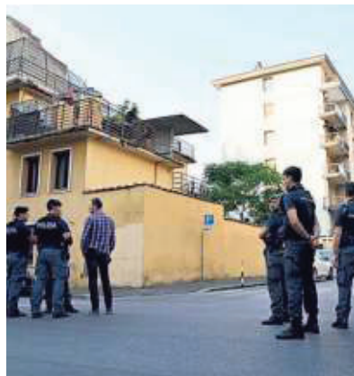
L'ex hotel Astor

L'edificio da cui è sparita Katalaya Chiuse le indagini su quattro persone